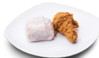
PAKET 11 1 Potong Paha Bawah + Nasi Rp 11.000