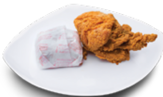
PAKET 13 1 Potong Dada + Nasi Rp 13.000

Rp 15.000 Rp 14.000 Dada / Paha Atas Sayap / Paha Bawah