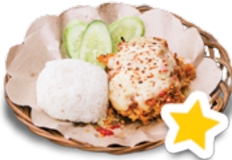
Geprek Mozzarella +Nasi

Rp 20.000 Rp 18.000 Dada / Paha Atas Sayap / Paha Bawah