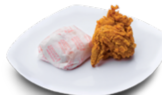
PAKET 11 1 Potong Sayap + Nasi Rp 11.000