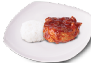
Spicy Chicken + Nasi

Rp 15.000 Rp 14.000 Dada / Paha Atas Sayap / Paha Bawah