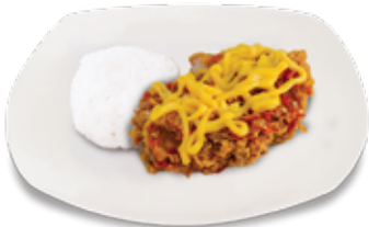
Geprek Keju + Nasi

Rp 15.000 Rp 14.000 Dada / Paha Atas Sayap / Paha Bawah