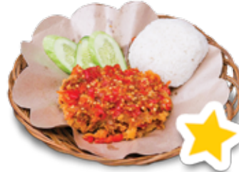
Geprek Original +Nasi

Rp 15.000 Rp 14.000 Dada / Paha Atas Sayap / Paha Bawah