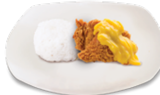
Cheesy Chicken + Nasi

Rp 20.000 Rp 18.000 Dada / Paha Atas Sayap / Paha Bawah