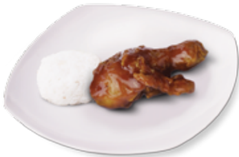
BBQ Chicken + Nasi

Rp 15.000 Rp 14.000 Dada / Paha Atas Sayap / Paha Bawah