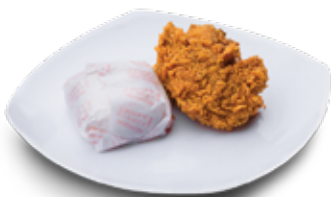
PAKET 13 1 Potong Paha Atas + Nasi Rp 13.000